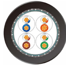
CAT5e 轨交车辆 以太网电缆