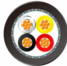
MVB 轨交车辆 总线电缆