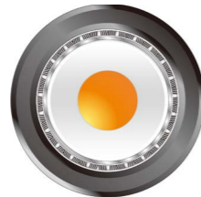
轨交车辆 同轴电缆