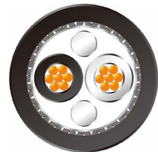
WTB 轨交车辆 总线电缆