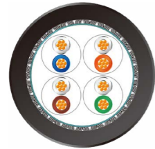
CAT7 轨交车辆 以太网电缆