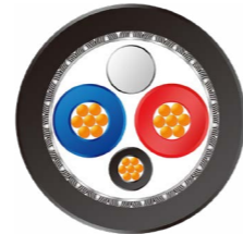
CANBus 轨交车辆 总线电缆