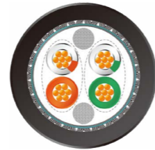
CAT5e 轨交车辆 以太网电缆