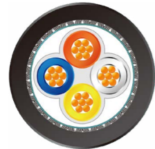
ETH 轨交车辆 以太网电缆